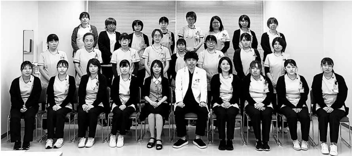
クラーク委員会委員長 丸山医師・小林医事課長・クラーク

医療クラークの正式名称は「医師事務作業補助者」です。当院では「クラーク」と呼ばれています。