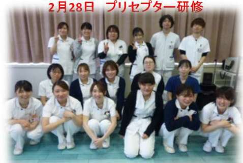
2月28日 プリセプター研修

それぞれの「心に残った看護」を共有しました。 たくさんの素晴らしい看護をありがとう！！